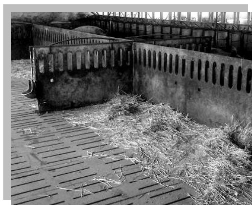
Paglia su un pavimento parzialmente fessurato

Per quanto concerne la gestione pratica del sistema di eliminazione dei liquami, il raschiatore meccanico utilizzato, la pompa ed altri aspetti tecnici, non sembra essere disponibile un'unica soluzione. La gestione e gli aspetti tecnici del sistema di eliminazione dei liquami dovrebbero essere adattati alla situazione presente nell'allevamento in questione.