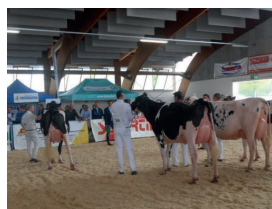
Fiera di Saluzzo