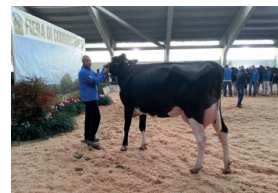
Fiera di Codogno