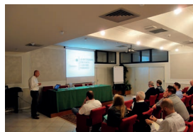
Incontri di presentazione delle novità aziendali