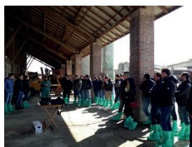
Fiera di primavera a Saluzzo