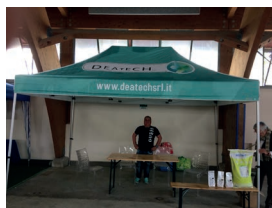
Fiera primaverile di Carmagnola