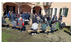
Giornate in azienda