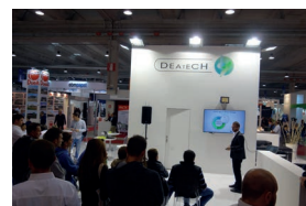
Fiere Zootecniche Internazionali di Cremona